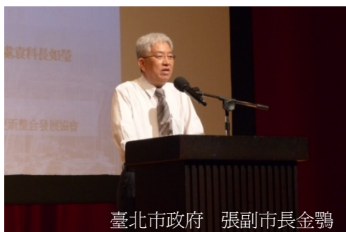
臺北市府 張副市長金鶚