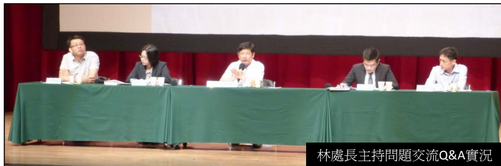
林處長主持問題交流Q&A實況